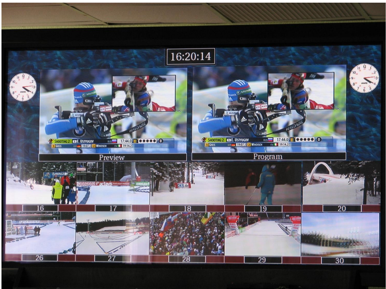
Рис 2. Спецэффекта живого окна автоматически выводимого от судейской системы SIWIDATA генератором ИНТВ «МИРАЖ» Вид на программном мониторе режиссёра.

Стоит отметить, что в этом году, в отличие от предыдущих, вывод спецэффекта окна с титрами генератором «Мираж» был полностью автоматизирован и сопряжен с официальной информационной системой IBU - SIWIDATA (Германия), которая формирует время отсечек от транспондеров, подсчитывает количество выстрелов и попаданий, а также выводит эту информацию в виде телевизионных титров.